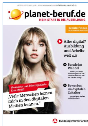
Inhalt/Download Heftübersicht planet-beruf.de