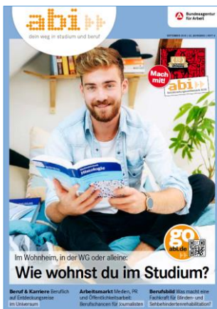
Inhalt/Download Heftübersicht abi.de